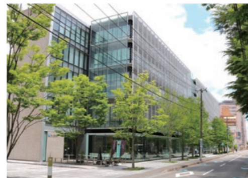
土樋キャンパス ホーイ記念館