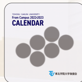
後援会リーフレット