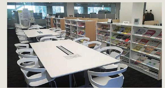
土樋キャンパス就職キャリア支援課 資料コーナー

コミュニケーションアプリ「LINE」を利用して、登録した3・4年生対象に就職キャリア支援課のガイダンスやセミナーの案内など就職に関する情報を配信し、携帯電話から常に最新の情報を得ることができます。