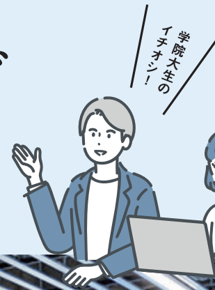
五橋2F オープンスクエア